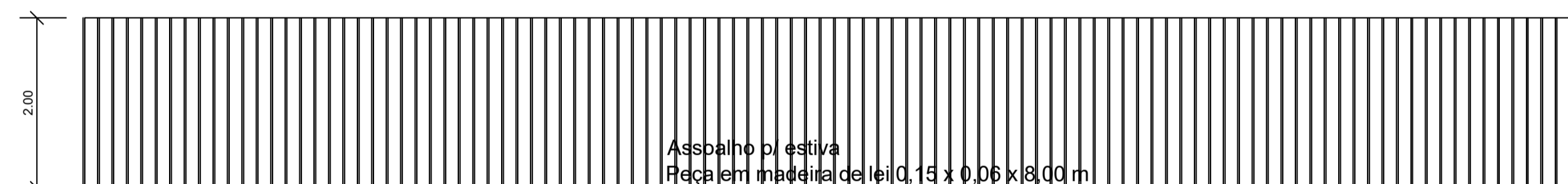
DET. 01 - VISTA SUPERIOR esc.: 1/50